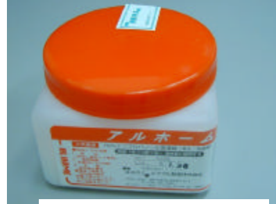
消毒用アルコール綿