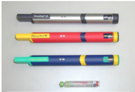
ノボペン（インスリン注射器）