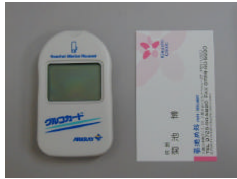
グルコカード（自己血糖測定器）