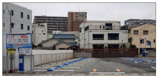
GSパーク近鉄八尾駅北第二駐車場

当院で1時間以上時間がかかった場合は考慮しますが、調剤薬局や買い物でかかった時間までのご容赦ください。