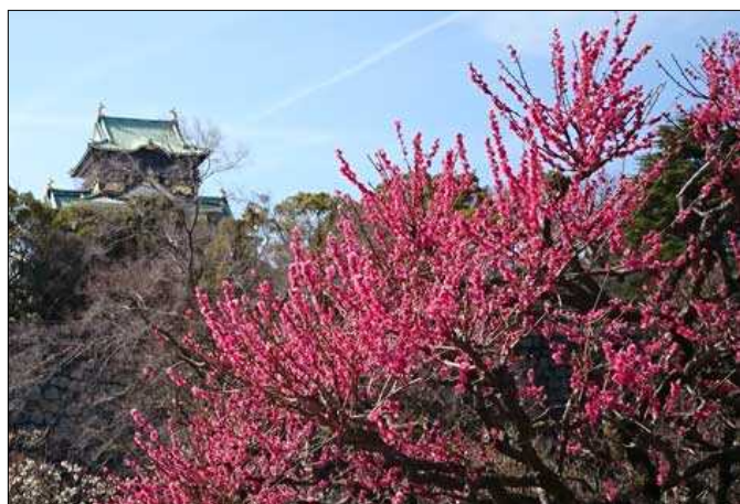
(左) 3月12日、満開との噂を聞き、大阪城梅林へ行ってきました。

余談ですが、ペリー一行は太平洋を横断してやってきたものではありません。アメリカ東海岸のノーフォークを出港し大西洋を横断、ケープタウン（南アフリカ）→セイロン→シンガポール→マカオ・香港→上海と経由して琉球に着いています。