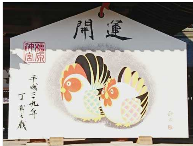
(上) 新年号恒例の檀原神宮の大絵馬

・毎月初回の受診時には「保険証」「医療証」等をご持参下さい。 ・お薬手帳・健診結果・紹介状等をお持ちになった場合は、先に受付へお出しください。