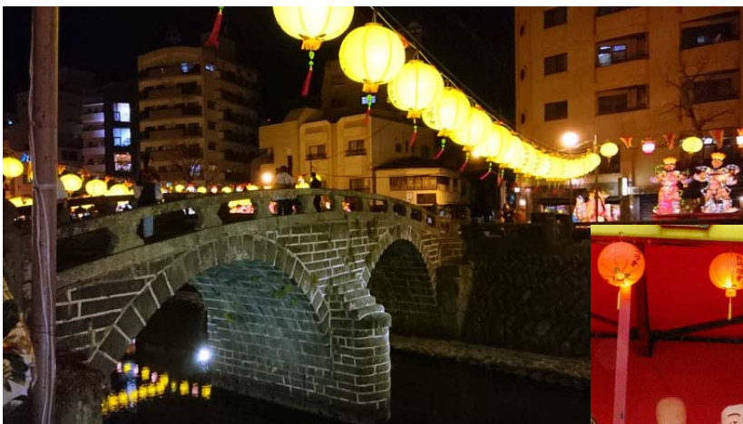
ここは黄色のランタンです。 (中島川公園会場：眼鏡橋)