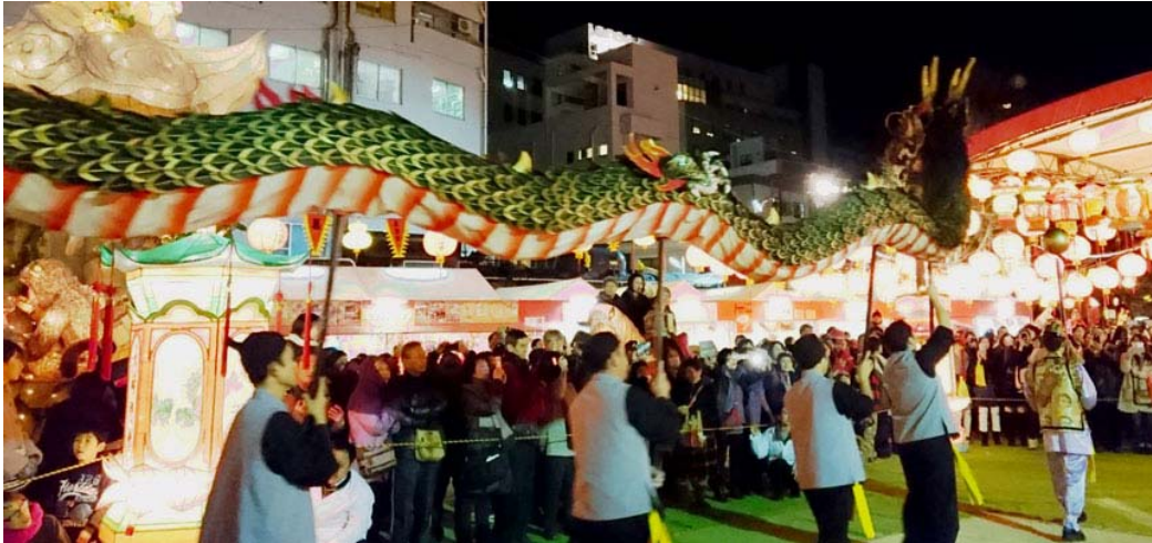
龍踊り (中央公園会場) 飛び入りで参加も できます。

開催期間は毎年変わり、今年は2月8日から22日の15日間でした。来年は1月28日（土）から2月11日（土）です。寒い時期ですが、いかがですか。