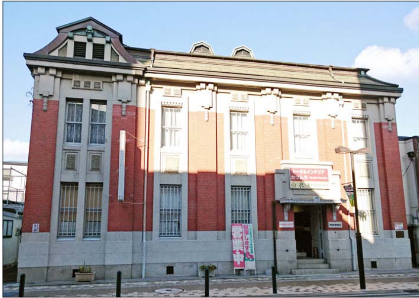
阪急宝塚線・池田駅から北へ徒歩10分

NHKの朝ドラ「あさが来た」で、あさちゃんは銀行を作りました。加島銀行（ドラマでは加野銀行）です。当時の建物としては、加島銀行池田支店の建物が、現在唯一残っています。1918年に建てられたということで、築98年になる石造りの建物です。