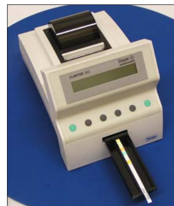
（左）血糖・コレステロールなどの測定器、（中）HbA1c測定器、（右）尿検査器