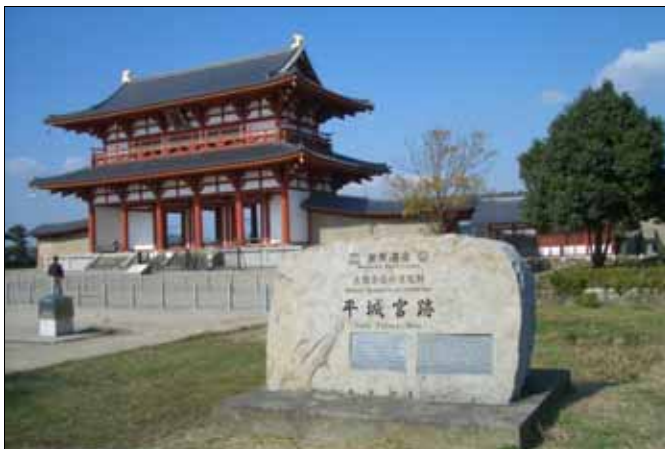
(左) 世界遺産 すざくもん ・平城宮跡(朱雀門) 甲子園球場が30個 入る広さだそうです。