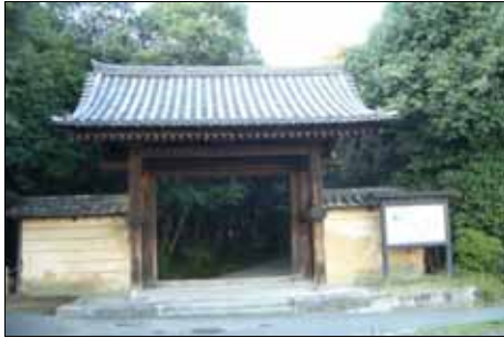
すいにん (上左) 垂仁天皇陵：大きなお墓です(227m x 118m) (上中) 菅原神社：菅原道真公、生誕の地とされています。 (上右) 西大寺 (左) 秋篠寺